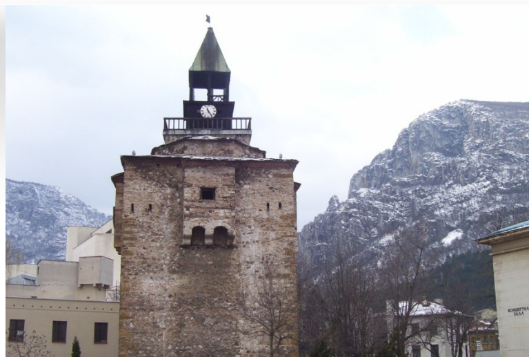
Vraca, Bugarska, 21-24.06.2010.

Preduzetnice su učestvovala u raspravi i o genderu i međunarodnim odnosima, studijama koje se bave pitanjima žena, ženskim kongresima i nevladinim organizacijama, gender politici i specifičnim teorijama.